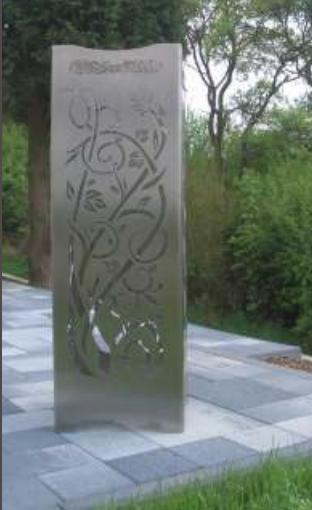
Feuersäule aus Edelstahl mit fein geschliffener Oberfläche, inkl. Feuerrost