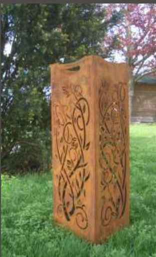
Feuersäule aus Cortenstahl mit schöner Rostpatina, inkl. Feuerrost