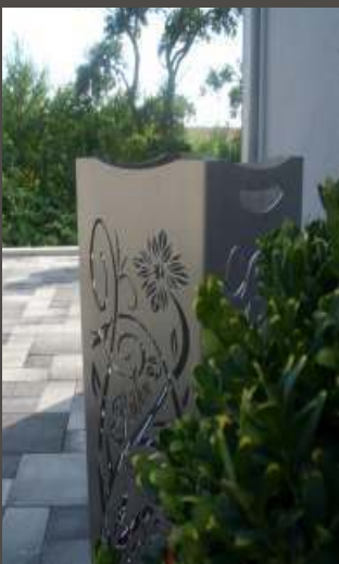
Aufpreis für individuellen Schriftzug (max. 10 Zeichen)